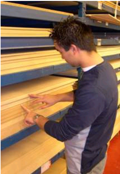
De Assistent houtbranche haalt plaatmateriaal uit het magazijn.