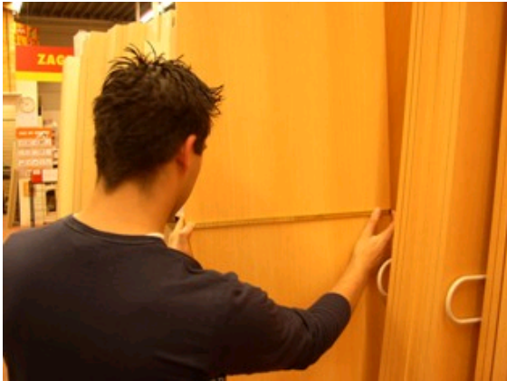
De Assistent houtbranche meet het plaatmateriaal.

In de houthandel zal hij vaak helpen met het inventariseren en verzamelen van hout en plaatmateriaal. Bij het verzamelen moet hij ook op de kwaliteit van het materiaal letten, bijvoorbeeld of het hout niet kromgetrokken is. De kenmerken waar hij op moet letten worden hem vooraf duidelijk verteld, zodat hij goed weet waar hij naar moet kijken.